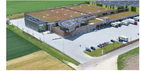
SEIT 2010 Unser Lager in Lonsee bei Ulm