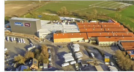
SEIT 1975 Der Firmensitz in Coesfeld